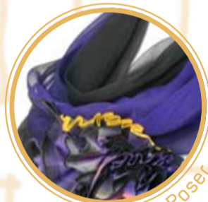
Inge von Poser